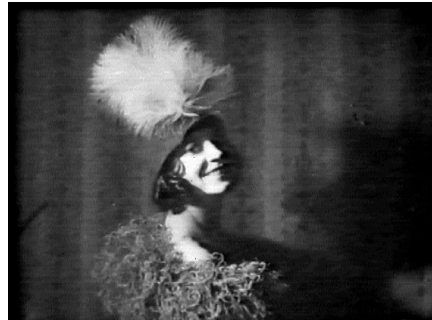
Abb. 3 Asta Nielsen in DIE BÖRSENKÖNIGIN (D 1918)

Ähnliche Fälle zeugen davon, dass es sich bei dieser Form um eine verbreitete Praxis handelte. Als Beispiele lassen sich die Bilder der frech und lustvoll Johannisbeeren verschlingenden Ossi Oswald in der Prologeinstellung zu ICH MÖCHTE KEIN MANN SEIN (D 1918, Ernst Lubitsch) oder der im Gras der Sommerfrische (also bereits am Handlungsort und im Rollenkostüm) herumtollen-