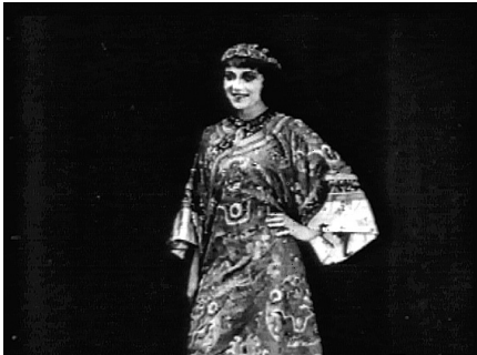
Abb. 2 Asta Nielsen in DIE VERRÄTERIN (D 1911/12)

den Personen vor, sondern führten jetzt auch die bislang unerwähnten Namen der wichtigsten Schauspieler auf. Der Star fand dabei besondere Hervorhebung, zumindest erschien sein Name größer gesetzt als die anderen, vielfach erschien er sogar auf einem gesonderten Zwischentitel. Daran schloss sich dann sehr häufig eine Einstellung an, die im erläuterten Sinne Prolog-Charakter besitzt, also nicht in die Handlungswelt integriert, sondern diskontinuierlich ange-