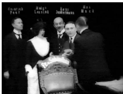
Abb. 5.1-5 WO IST COLETTI?

xes Beispiel dieser Art. Der Prolog besteht aus mehreren Einstellungen, hat deutlich über zwei Minuten Länge und nutzt intensiv Animationstechniken. Der Autorenfilm-Strategie folgend, erscheint – durch einen Zwischentitel angekündigt – zunächst Franz von Schönthan, der Autor, an einem Schreibtisch frontal vor der Kamera sitzend. Er nimmt einen Anruf entgegen, zeigt die Pose eines Geistesblitzes und beginnt lächelnd (Komödie!) zu schreiben. Bis zu die-