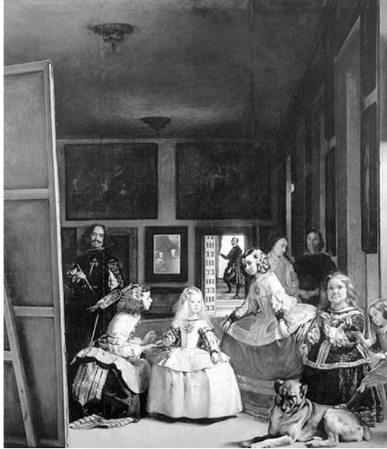
3 Las Meninas von Diego Velázquez (1656)

im Fluchtpunkt befindet (es handelt sich bekanntermaßen um König Philipp IV. und seine Frau). Was diesen aber in der Szene Präsenz und Notwendigkeit verleiht, sind die Blicke aller Figuren im Bild, die auf sie gerichtet sind, während man für den Maler posiert, der im Selbstporträt zu sehen ist. Auf die allgemeinen Implikationen dieser Repräsentation, die Michel Foucault (1971 [1966]) analysiert hat, werde ich nicht weiter eingehen. Betonen möchte ich lediglich die Kühnheit, ja Anmaßung dieser Verführungskunst, die den Betrachter nachgerade zu der Annahme zwingt, dass sich die Szene über die Ränder des Gemäldes hinaus erstreckt; die ihn gleichzeitig innen festhält und nach außen stößt; die die Macht der Darstellung vervielfacht, das Nichtdargestellte, wenn nicht gar das Nichtdarstellbare anzudeuten; und die ihn einen unendlichen Raum erahnen lässt.