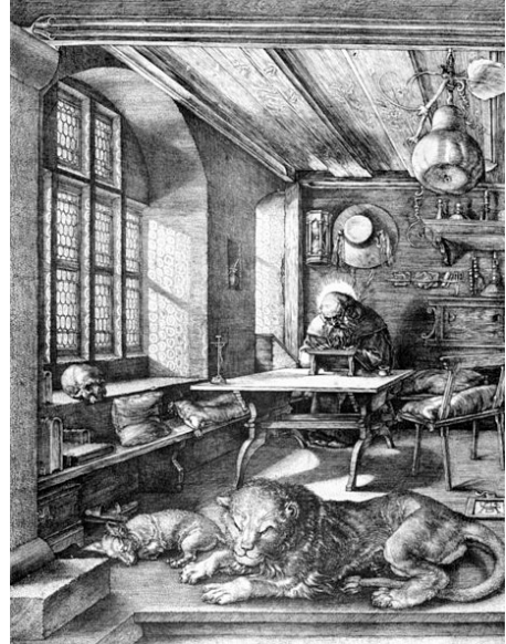
1-2 Der heilige Hieronymus im Gehäus links von Antonello da Messina (um 1474) und rechts von Albrecht Dürer (1514)

bei dem die geringere Distanz und der leicht schräge Winkel die Wirkung von Intimität und den Eindruck «einer nicht durch die objektive Gesetzmäßigkeit der Architektur, sondern durch den subjektiven Standpunkt des gerade eintretenden Beschauers bestimmten Darstellung» hervorrufen (ibid., 124). In gewisser Weise «ergreifen» die Nähe und der Blickwinkel den Betrachter und ziehen ihn ins Gemälde hinein.