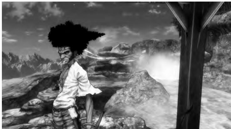
1 TV-Serie AFRO SAMURAI (Japan 2007)

und das Ganze auch auf diese Weise rezipiert werden will. Anders als in der Episodenserie ( series ) mit in sich abgeschlossenen Folgegeschichten wird hier nicht eine ähnliche Geschichte immer wieder erzählt, sondern eine Geschichte auf ähnliche Weise immer weiter erzählt. Dies geschieht allerdings nicht notwendig linear: AFRO SAMURAI ist von einer verschachtelten Erzählstruktur geprägt, die insbesondere in zahlreichen Rückblenden und intern fokalisierten Traumsequenzen sowohl Kindheit als auch Ausbildung des Protagonisten schildert. Ferner schließt die Serie in der fünften und finalen Episode nicht mit einer konventionellen Konfliktlösung, sondern endet abrupt, wenn Afro zwar den Tod des Vaters gerächt hat, nun aber seinerseits von einem alten Widersacher aus Jugendtagen zum Kampf herausgefordert wird.