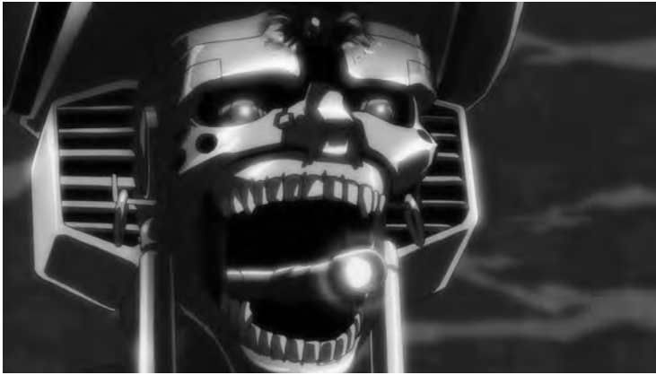
4 Anspielungen auf das Science-Fiction-Genre in AFRO SAMURAI (TV-Serie)

ferenten, ja überhaupt auf Bezüge zur japanischen Geschichte. Es operiert lediglich mit bekannten generischen Versatzstücken und spielt so mit dem medienkulturellen Wissenshorizont des Publikums.