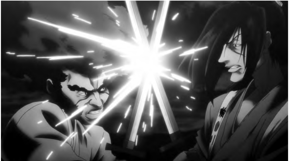
Typischer anime -Look: AFRO SAMURAI: RESURRECTION (Japan 2009)