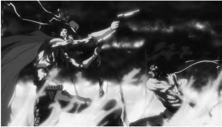
3 Western- Elemente im Showdown der TV-Serie

sie streift. In der Diegese von AFRO SAMURAI trifft Hochtechnologie wie Cyborg-Wesen, Mobiltelefone und Raketenwerfer auf ein japanisches Mittelalter, das durch seine Repräsentation in chanbara bekannt ist. Hinzu kommen ikonografische, aber auch motivische Elemente aus zahlreichen weiteren Genres: Der finale Gegner des Protagonisten ist wie eine Western-Figur gekleidet, mit Stetson-Hut und langem Staubmantel, unter dem er sechsschüssige Revolver trägt; 2 der Topos um den Hegemoniestreit unter den Schwertkämpfen stammt aus der Tradition von chinesischen Martial-Arts-Narrativen und wuxia -Mythen (vgl. Teo 2009); und Afro selbst wird stets begleitet von einem imaginären Alter Ego, das aber dennoch eine irritierende materielle Präsenz besitzt, immer wieder mit der Umwelt interagiert und daher dem Fantasy-Genre zuzurechnen wäre.