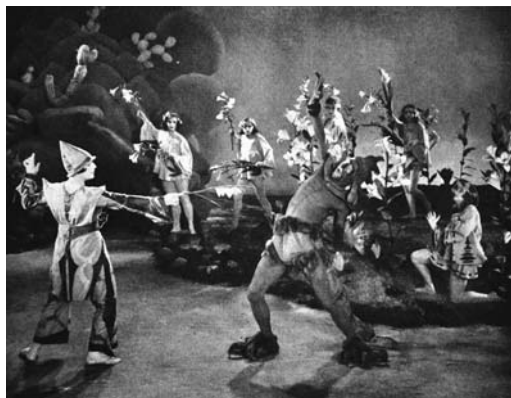
3–4 Szenen aus DER DRACHENTÖTER (1927 oder 1928)

Im Gespräch mit Eisner erwähnt Laban außerdem einen «größeren Tanzfilm», den er mit Wilhelm Prager plante und der die Prinzipien seiner Tanzschrift veranschaulichen sollte. Tatsächlich finden sich in seinem Teilnachlass im Tanzarchiv Leipzig Skizzen zu einem Lehrfilm unter dem Titel DAS LEBENDE BILD. Mit ihm wollte Laban sein Notationssystem für ein breites Publikum aufbereiten. Es ist davon auszugehen, dass dieses Projekt – wie viele andere Filmmanuskripte, die Laban gegen Ende der 1920er Jahre verfasste – nicht realisiert wurde. Dabei mangelte es ihm weder an der Überzeugung, dass der Film ein geeignetes Medium für die Vermittlung seiner Tanz- und Bewegungslehre sei, noch am Vorstellungsvermögen, wie diese filmisch konkret umzusetzen sei. So schwebte Laban für den Kinetographie-Lehrfilm vor, dass sich Aufnahmen von «Fussstapfen im Schnee» nach und nach