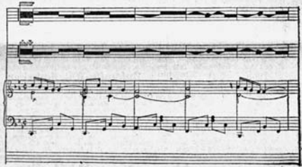
Erklärung zu Labans Schrifttanzproben des Linienstiftens.

Wenn der Zeitgeist sich Kulturfortschritt. Wenn etwas unsere Zeit vorüberlassen kann, so ist es das neue Gefühl für die Bewegung, für den Schmelzpunkt im Bewegung. Dies können das heißt aber