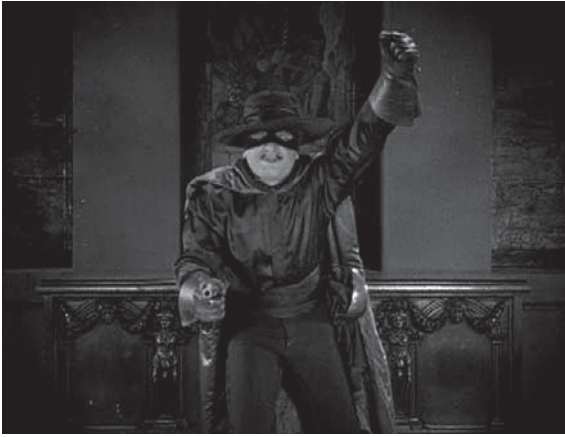
Abb. 2 Don Diego Vega als Zorro (Douglas Fairbanks) in THE MARK OF ZORRO (Fred Niblo, USA 1920)