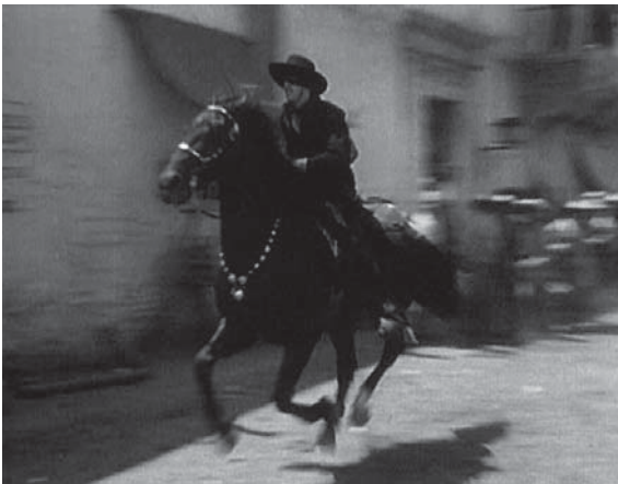
Abb. 3 Don Diego Vega als Zorro (Tyrone Powell) in THE MARK OF ZORRO (Rouben Mamoulian, USA 1940)

Mary Pickford 1919 gegründet hatte – bilden die beiden Filme den Ausgangspunkt für eine Reihe von Abenteuerfilmen, die sich über die ganzen 1920er Jahre hinweg fortsetzt und in denen Fairbanks als D'Artagnan, Robin Hood oder auch als <Black Pirate> zu sehen ist. Stets handelt es sich dabei um Figuren, die etwas mit Zorro gemeinsam haben, dem unermüdlichen Kämpfer gegen die Missbräuche institutioneller Macht, dem maskierten Rächer, der wie ein Bandit behandelt wird. Erinnerungswert ist ferner das Remake von Rouben Mamoulian, THE MARK OF ZORRO (IM ZEICHEN DES ZORRO, USA 1940), ein klassischer Hollywood-Film mit Tyrone Powell, der zwanzig Jahre nach dem ersten Film dessen narrative, diskursive und oft auch enunziative