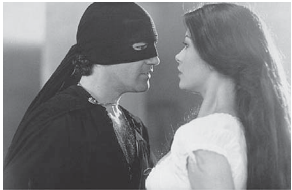
Abb. 8 Zorro-Alejandro und Elena (Catherine Zeta-Jones) in THE MASK OF ZORRO (1998)