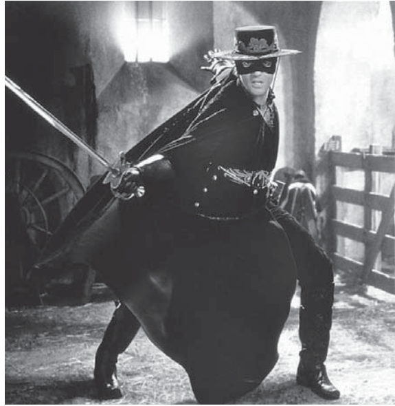
Abb. 4 Alejandro Murrieta als Zorro (Antonio Banderas) in THE MASK OF ZORRO (Martin Campbell, USA 1998)

erscheinen die ersten Comic-Hefte mit Zorro als Hauptfigur, die ebenfalls von Disney auf den Markt gebracht werden. 8 Aus den Fernsehfilmen und den Comics geht in Italien auch eine Fernseh-Show hervor, und 1975 kommt der Zorro-Film in die Kinos, der der Generation des Schreibenden neben der Fernsehfassung am stärksten in Erinnerung geblieben sein dürfte: ZORRO (I/F 1975, Duccio Tessari) mit Alain Delon in der Hauptrolle. Die Verwertung der Zorro-Saga wurde aber auch mit neuen Fernsehserien