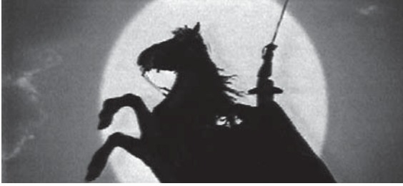
Abb. 5 Don Diego de la Vega als Zorro (Anthony Hopkins) in THE MASK OF ZORRO (1998)

(DIE LEGENDE VON ZORRO, USA 2005) eine Fortsetzung gefunden, beide unter der Regie von Martin Campbell.