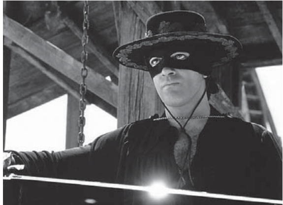
Abb. 6 Alejandro Murrieta als Zorro (Antonio Banderas) in THE MASK OF ZORRO (1998)

der Hilfe zweier unternehmungslustiger Jungen – die mit einer Medaille zu belohnen er noch nebenbei die Zeit findet – der gefährlichen Falle, welche ihm der Gouverneur gestellt hat, gelang schließlich in die Räumlichkeiten des verhassten Tyrannen und hinterlässt sein unauslöschliches Mal an dessen Hals. Alles ganz locker dargeboten und bewundernswert