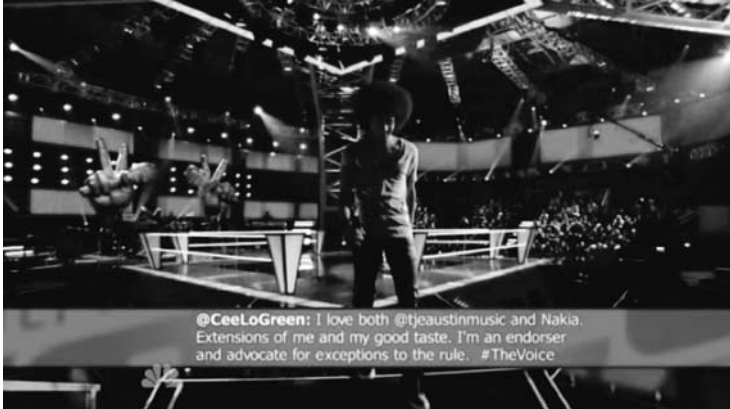
4 Ein Beispiel von «Massen-Selbst-Kommunikation» in THE VOICE

ist und, wie wir gezeigt haben, das Zusammenspiel von Produzenten und Kandidaten der Show Produzenten-zentriert formatiert und ausgesprochen begrenzt ist, ähnelt die Interaktion zwischen Programm, Kandidaten und Zuschauern nach wie vor der traditionellen para-sozialen Interaktion des broadcast -Fernsehens. Ein wesentlicher Unterschied zwischen beiden Formen ist jedoch, dass das gegenwärtige soziale Fernsehen Zuschauer tatsächlich in viewer verwandeln kann, wie die Rhetorik von THE VOICE betont. Hierbei spielt der Gebrauch sozialer Medien während der Live-Sendung eine wesentliche Rolle, und THE VOICE hat in ihrem Raum der Partizipation neue Formen entwickelt, Liveausstrahlung und synchronen Gebrauch sozialer Medien miteinander zu verweben, um so das Gefühl der unmittelbaren kommunikativen Verbindung zwischen Programm und Zuschauern zu verstärken.