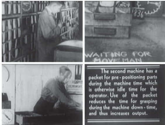
Anwendung auf andere Industriebranchen: Rationalisierung von Verpackung und Versand, dargestellt in einem amerikanischen Film über Frank B. Gilbreth aus dem Jahr 1948.

Dabei stellt sich allerdings ein spezifisches Wahrnehmungsproblem. Die Unterschiede zwischen den alten und den neuen Arbeitsroutinen erscheinen mini-