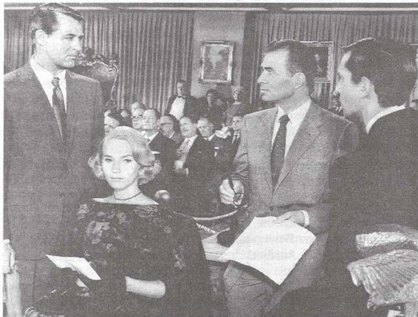
Die "Versteigerungs-Szene" – Photo: Stiftung Deutsche Kinemathek

(3) Eve Kendall ist in diesen Aufnahmen ganz und gar vergegenständlicht, dezentriert und passivisiert. Sie ist auch ikonographisch isoliert – nur schräg von oben zu erkennen, an den linken unteren Bildrand gedrängt.