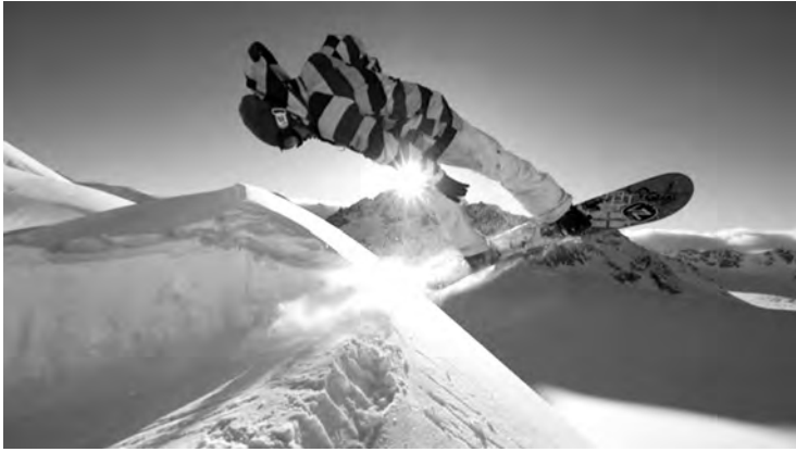
2 Superzeit- lupe in THE ART OF FLIGHT (USA 2011)

Bildstabilisierungssysteme der Kameras können wackelfreie, gestochen scharfe Bilder aus bis zu 600 Meter Entfernung aufnehmen. Computergesteuerte Joysticksysteme zur Ansteuerung der beliebig dreh- und schwenkbaren Kameras eröffnen neue Möglichkeiten für Kameraraschwenks und -zooms. Die bisher statische Helikopterperspektive bei Hochgebirgsaufnahmen ist nun flexibel beeinflussbar und erlaubt neue Formen der Kameraführung. Der Zugriff auf solche Helikopterkameras und auf technische Neuentwicklungen, wie Kameradrohnen (vgl. Elledge 2012) lässt die Montage unterschiedlicher Kameraeinstellungen zu. Insbesondere Kameradrohnen, deren Flugbahnen punktgenau per GPS vorprogrammierbar sind, ermöglichen Plansequenzen und Kameraraschwenks, die sich zuvor nicht oder nur mit hohem finanziellen Aufwand realisieren ließen. 18