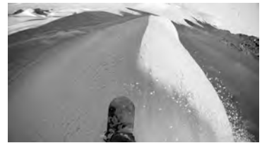
4 Point-of-View und Helikopter- Bilder in THE ART OF FLIGHT