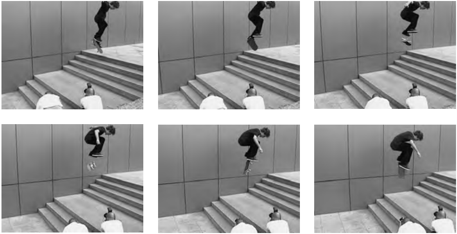
1 Der money shot. Fliptrick-Sequenz in Sekundenlänge aus dem Skatefilm FULLY FLARED (USA 2007)